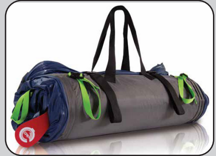
DualPlus Matratzensersatzsystem S2205-A5010/A040