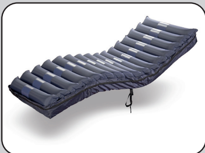
DualPlus Matratzenauflagesystem ME S2809-2010