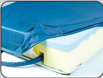
DualPlus Matratzensersatzsystem A803-5/A803-61-DualSoft